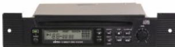
MCD-705 Professzionális CD-játszó modul Rázkódásmentes, ismétlés funkcióval