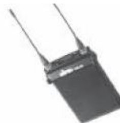
MR-90A 16-csatornás True Diversity zsebvevő