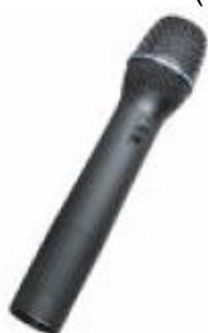
ACT-707HE Kéziadó, kondenzátor, kardioid