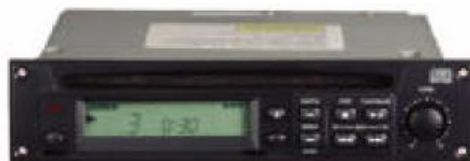
MCD-705 Professzionális CD-játszó modul Rázkódásmentes, ismétlés funkcióval