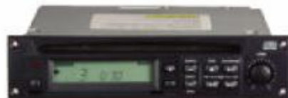
CD-játszó rázkódásmentes, ismétlés funkcióval