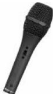
MM-101 Vezetékes dinamikus mikrofon, kardioid