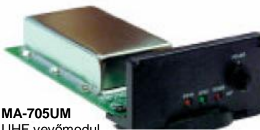
MA-705UM UHF vevőmodul