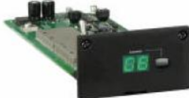
MT-90 Adómodul ACT szkennelés funkcióval, LED csatornakijelzéssel