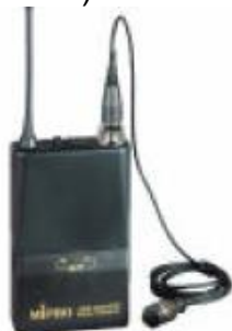
ACT-707TE Zsebadó + Kitűzőmikrofon/ fejmikrofon