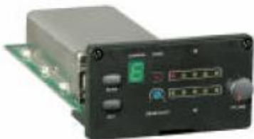
MRM-70 UHF True Diversity vevőmodul ACT funkcióval